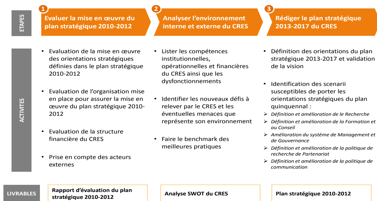
Figure 1 : Méthode d'élaboration du plan stratégique

Le plan stratégique 2013-2017 du CRES sera accompagné d'un dispositif de suivi-évaluation dont l'objectif est de fournir un cadre régulièrement alimenté au regard de l'atteinte des cibles que le Consortium s'est fixé. Ce dispositif permettra surtout de rendre plus efficace et efficiente l'évaluation future du présent plan stratégique.